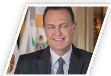
MAURICIO KURI GONZÁLEZ

Gobernador Constitucional del Estado de Querétaro