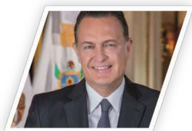
MAURICIO KURI GONZÁLEZ

Gobernador Constitucional del Estado de Querétaro